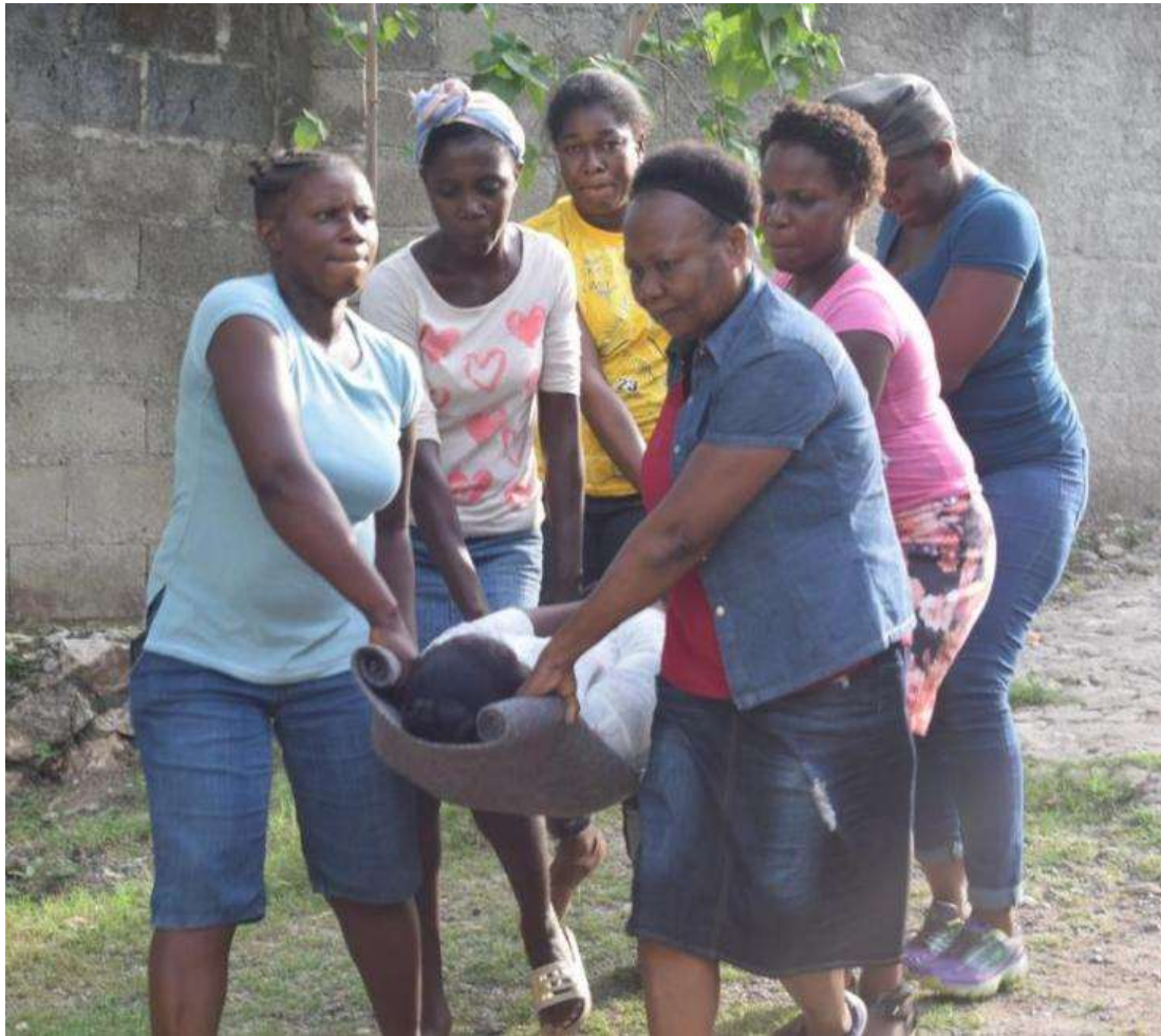
Femmes Leaders – Exercices pratiques premiers soins (Camp Louise, Nord)