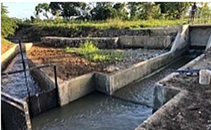
Micro barrage de Charlopin (Nord-Est)