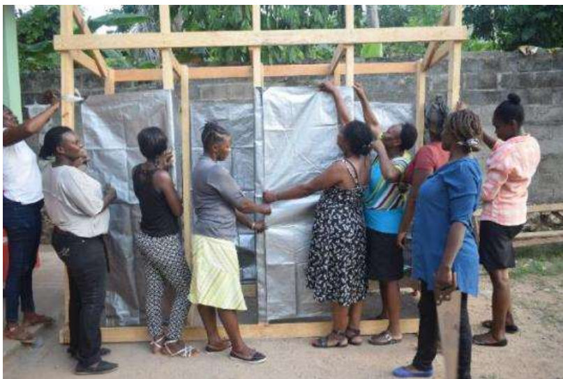
Femmes leaders – Exercices pratiques WASH (Camp Louise, Nord)