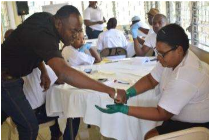
Formation premiers soins (Delmas, Ouest)