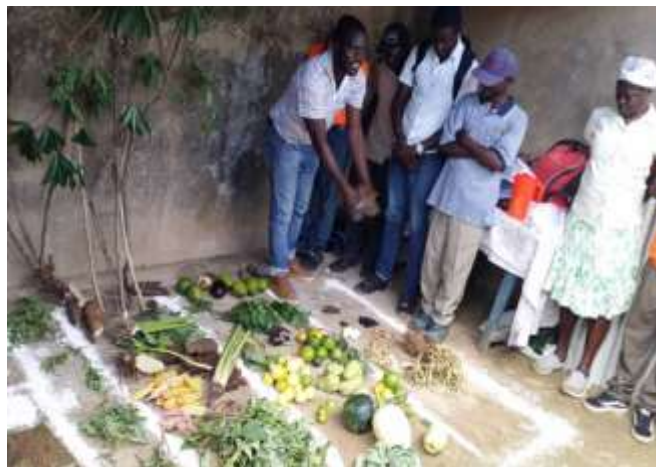
Formation pratique en agroécologie en petit groupe (Roseaux, Grand'Anse)

Via le programme régulier , mené en lien avec nos partenaires de terrain, les activités suivantes ont été réalisées dans les 5 départements d'intervention :