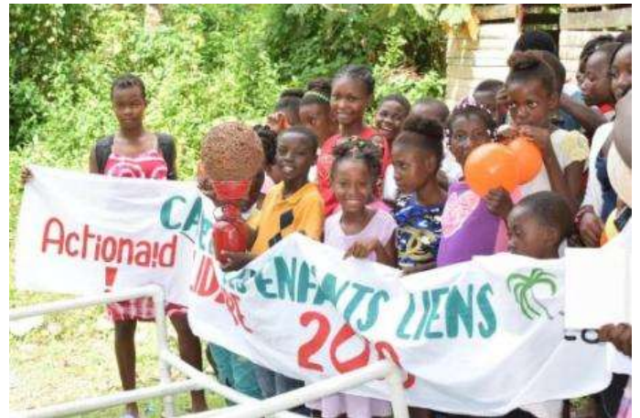
Programme régulier - activités Liens Solidaires (Lascahobas, Centre)

Au 31 décembre 2019, 4 030 enfants sont parrainés grâce au soutien de certains pays affiliés à la fédération ActionAid International (Royaume-Uni, Italie, Espagne, Brésil). Ces parrainages permettent de mettre en place les programmes réguliers communautaires et de répondre aux besoins de base des enfants et leur famille, en lien avec nos partenaires de terrain, dans 5 départements d'Haïti.