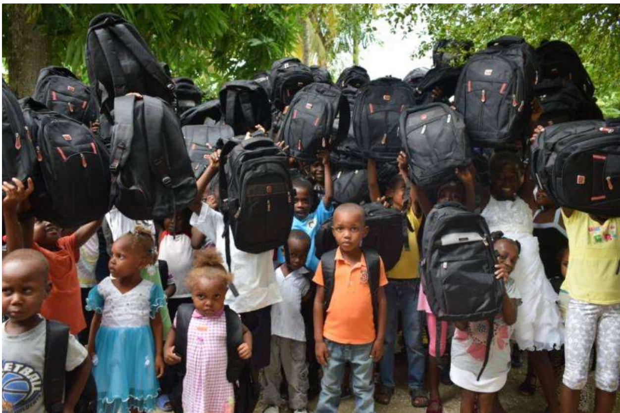
Programme régulier - distribution de kits scolaires /COSADH (Lascahobas, Centre)