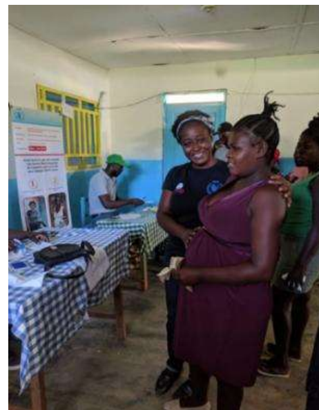
Une participante après avoir reçu un paiement (Mont-Organisé, Nord-Est)