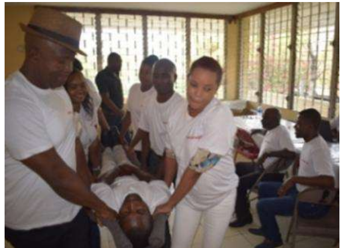
Exercice pratique premiers soins (Delmas, Ouest)