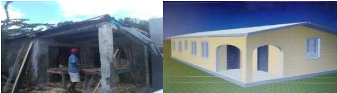
À gauche : unité de production de l'Ecole Professionnelle de Jérémie