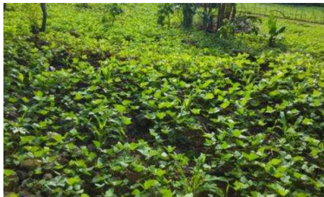
Parcelle de haricots noirs ( Roseaux, Grand'Anse)

Dans sa stratégie d'intervention visant la promotion d'une agriculture résiliente et des initiatives économiques innovantes pour les femmes et les jeunes, AAH a mené en 2019 des activités qui ont contribué à la dynamisation de l'agriculture paysanne, la promotion de modèle d'exploitation agricole durable et le développement d'entreprises d'agro-transformation et d'autres secteurs économiques porteurs. Ces grandes lignes d'activités ont été développées en prônant l'agroécologie et l'approche ADRC (Agriculture Durable Résiliente au Changement Climatique), intégrant les jeunes et en promouvant le leadership des femmes dans le secteur agricole.