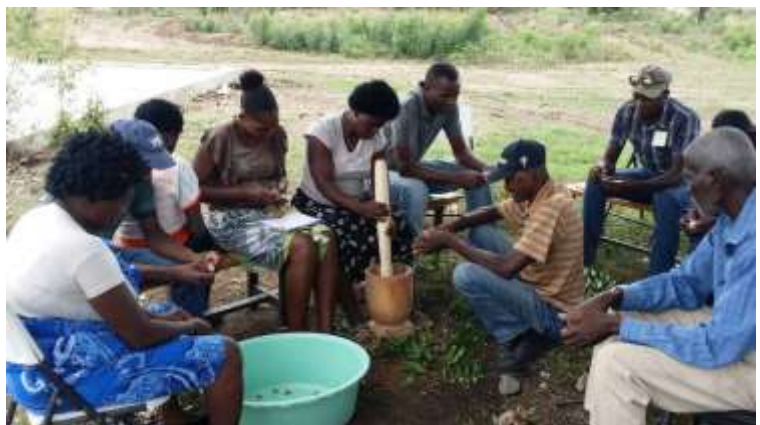
Agroécologie - fabrication d'insecticide naturel (Ouanaminthe, Nord-Est)