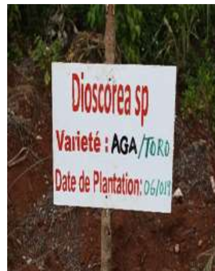
Parcelle de recherche sur les variétés d'igname en disparition (Beaumont, Grand'Anse)