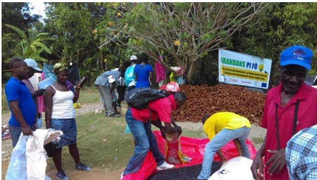
Distribution de semences au cours de la campagne de printemps (Roseaux, Grand'Anse)

3) Dans le projet Résilience des populations Urbaines de Jérémie , les activités suivantes ont été réalisées dans l'objectif de contribuer à améliorer la résilience et les conditions de vie des habitants des quartiers précaires de Jérémie :