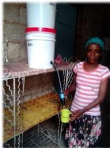
Une participante utilisant son filtre à eau (Petit-Goâve, Ouest)