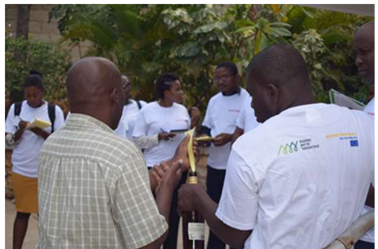
Exercice pratique – WASH (Delmas, Ouest)