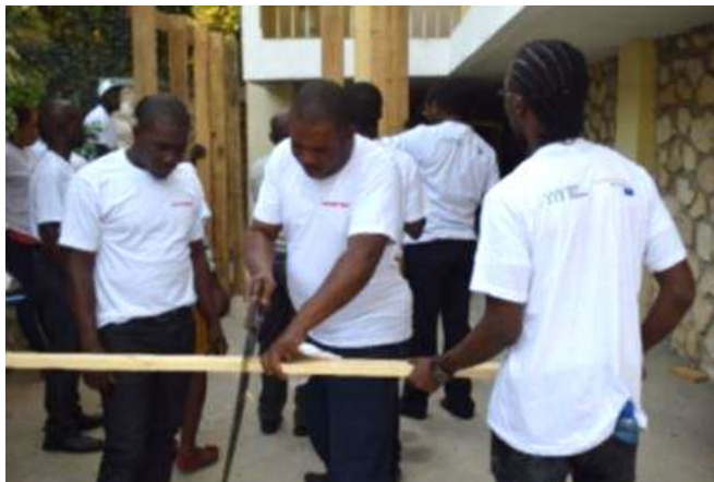
Partenaires réguliers et ponctuels – Formation WASH (Delmas, Ouest)

Via les projets ponctuels , les activités suivantes ont été menées :