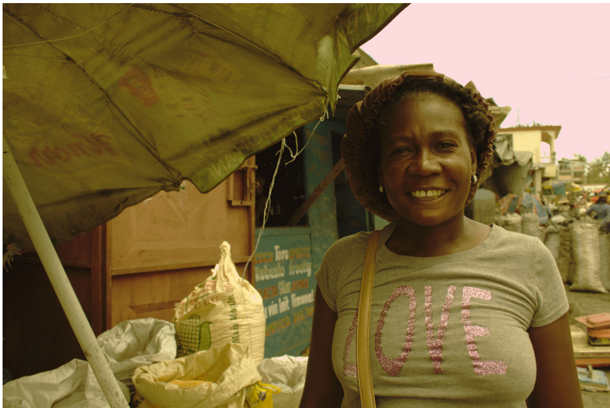
Une participante au programme de crédit à Juanarya, Hinche.