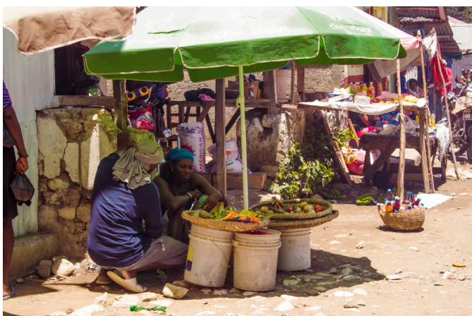
Des marchandes au marché de Marbial.