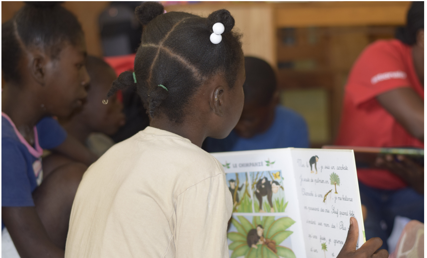
Des enfants durant une activité psychosociale à Jérémie, après le tremblement de terre de juin 2023.

Finalisation de la construction de quatre salles de classe, d'un terrain de jeu et d'un réservoir d'eau à Carrefour Charles, 4 e section de la commune des Roseaux, Grand'Anse. Ce projet a permis l'accès à un environnement d'apprentissage approprié à plus de 450 élèves.