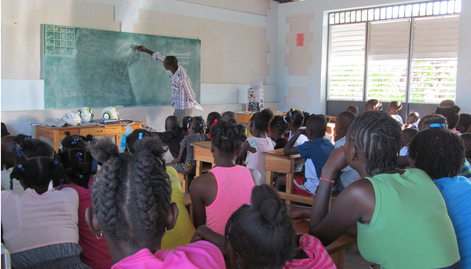
Séance sur les risques et désastres pour des enfants à Guillote, Jérémie.