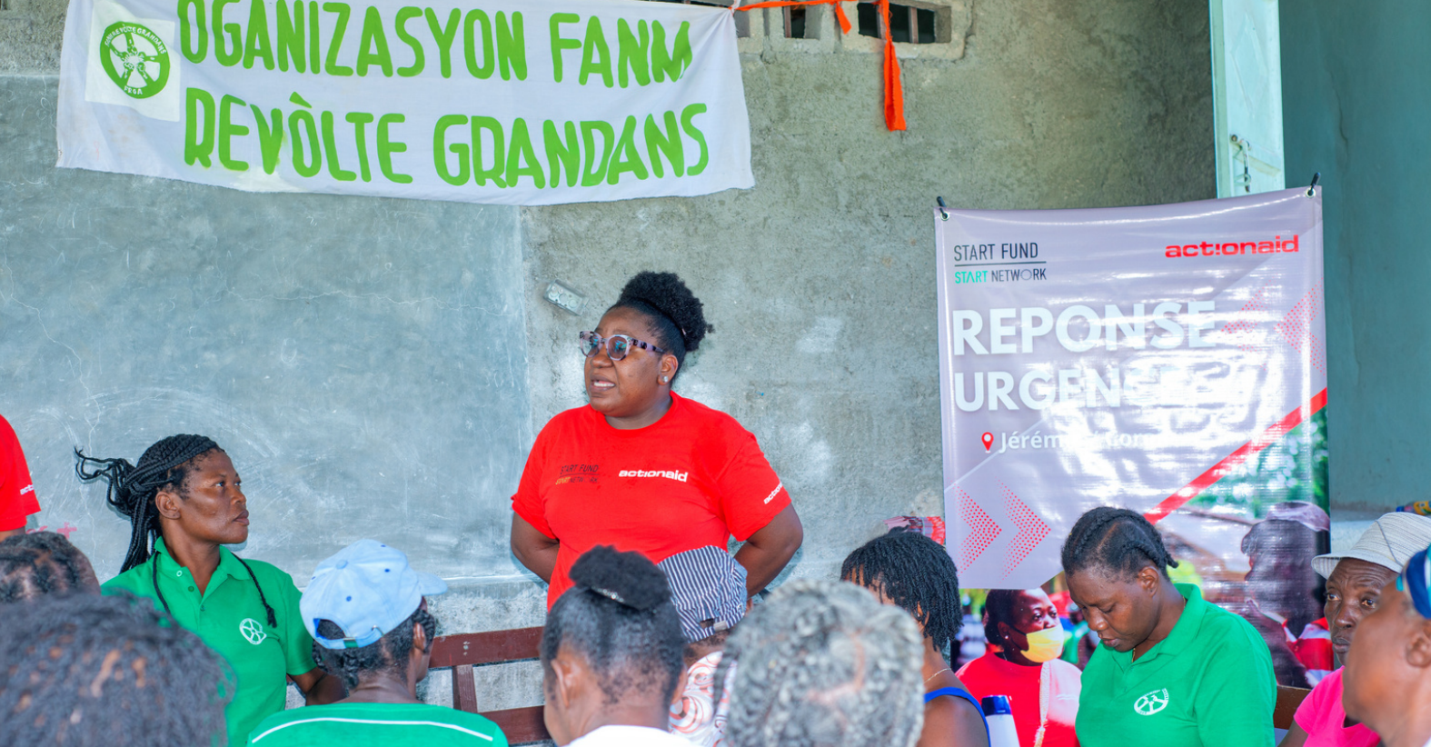
Séance sur la redevabilité durant à Corail, Jérémie.