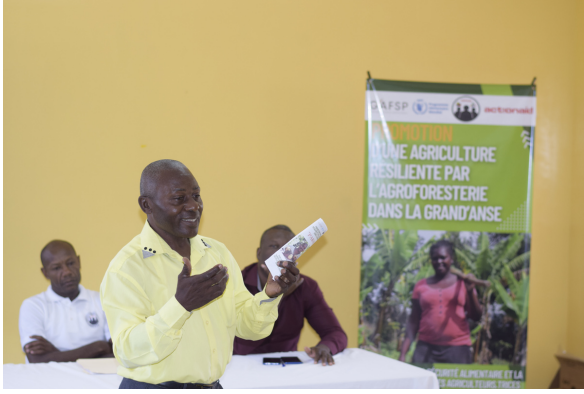
Membre CASEC, lors du lancement du projet PARAGA avec ROPAGA et le PAM