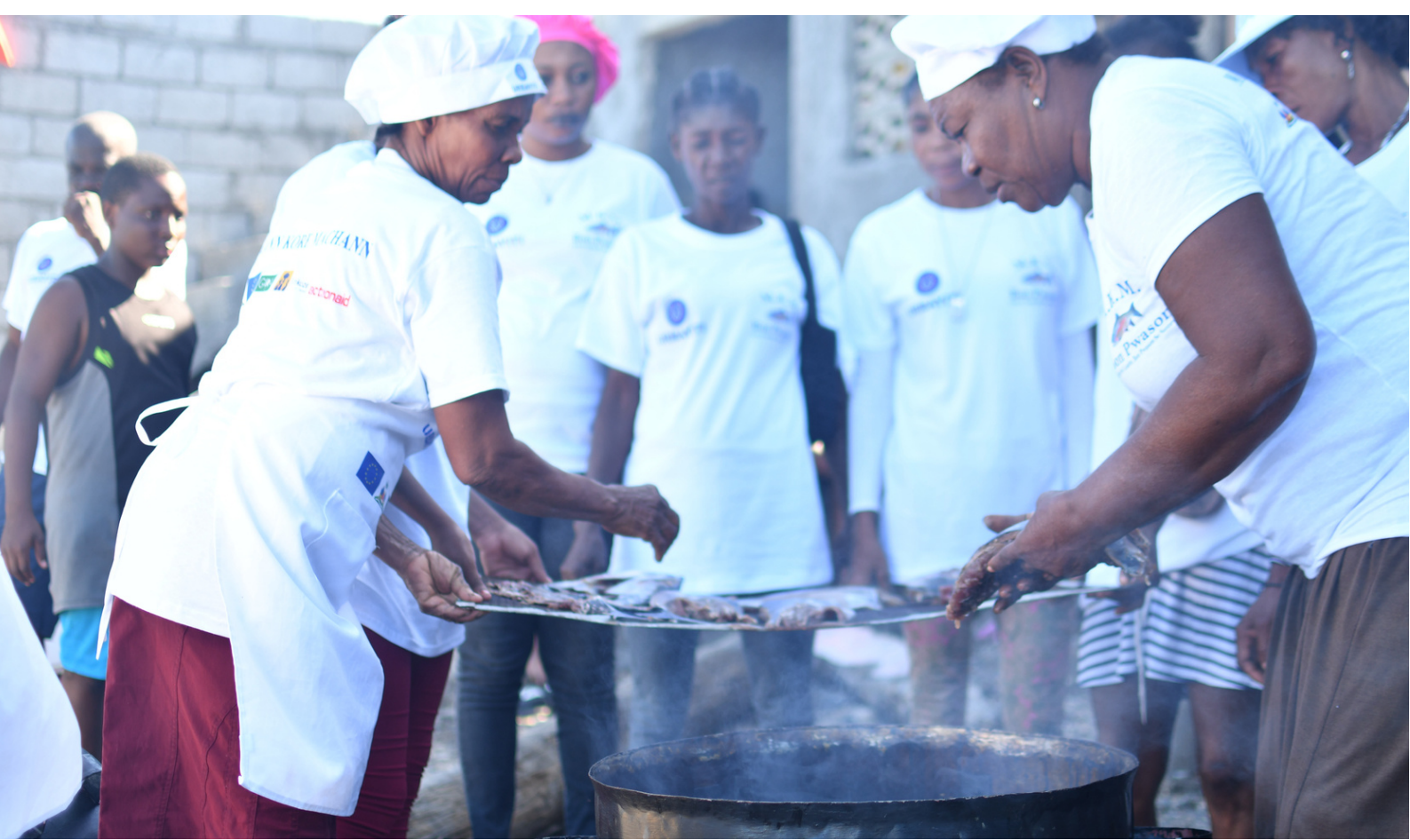
Associations de marchandes de poissons, faisant le séchage de produits. Jérémie.