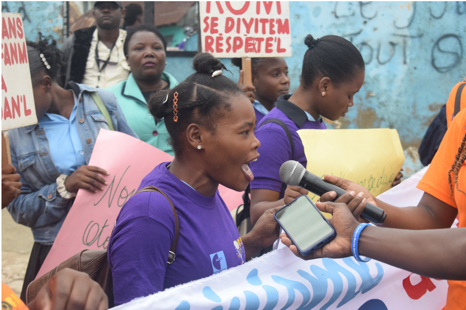
Une élève de lycée, protestant pour avoir un espace d'apprentissage sain.

Les activités de plaidoyer d'ActionAid Haïti tant au niveau national et international se portent principalement sur la Localisation de l'Aide, s'alignant sur la signature humanitaire qui promeut le leadership des femmes et des jeunes, le renforcement des capacités des acteurs locaux, la reddition de compte et la participation des communautés affectées par les crises. AAH participe activement dans les espaces de coordination de l'aide humanitaire et plaide pour :