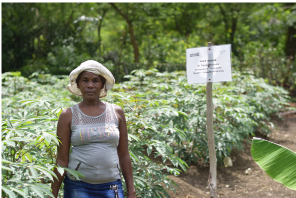
Un participant et une participante aux activités de relance agricole