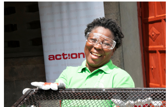
Des participantes au programme AGR.